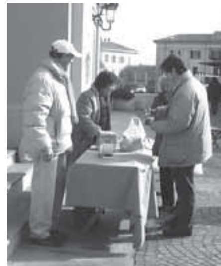
volontari dell'Atrap (Associazione Trinese Amici Pompieri), operativi fin dalle prime ore del mattino. In altri

(c.g.) - Una risposta corale quella della popolazione di Moncalvo all'iniziativa benefica «Le Arance della Salute» che sabato scorso ha avuto luogo nella cittadina aleramica a cura dei responsabili dell'Associazione Italiana per la Ricerca contro il Cancro.