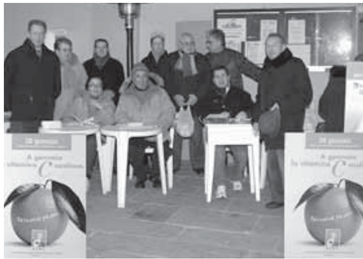
A sinistra i volontari dell'Airc durante l'iniziativa a Trino; a destra un momento della distribuzione a Moncalvo

a (mi) - Sono andate esaurite in poche ore le arance della salute che a Trino e nel circondario sono state distribuite dai volontari dell'Airc (Associazione Italiana per la Ricerca sul Cancro). Le arance rosse sono state consegnate a chi ha voluto diventare socio Airc o rinnovare l'adesione all'associazione, in reticelle da tre chilogrammi, grazie alla generosità della Regione Sicilia. Nella zona di Trino sono stati raccolti 10 mila euro (a fronte di 1.200 confezioni) da destinare alla ricerca. Insieme alle gustosissime arance è stato anche consegnato un numero straordinario della rivista fondamentale: uno speciale di 24 pagine ricco di consigli su come cambiare le abitudini sbagliate. Non è inoltre mancata la