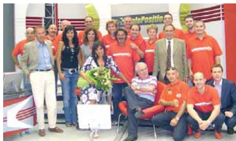
I soci del Ferrari Club di Mirabello ospiti della trasmissione di Rai 1 «Pole Position»

MIRABELLO - Si possono concentrare finalmente sulla grande festa del 17 settembre i quasi cento soci del Ferrari Club di Mirabello legalmente riconosciuto da Maranello con il numero 514, mentre dal 1° gennaio di questo anno i club fanno parte delle scuderie Ferrari insieme a tutti gli altri soci sparsi per il mondo. È proprio grazie alla innovativa gestione che tanti soci Ferrari del club mirabellese hanno avuto il privilegio di due appuntamenti speciali; sabato 27 maggio si è finalmente coronato un sogno particolare desiderato da tutti potendo visitare la fabbrica di Maranello. L'appuntamento era per le 15 davanti allo stabilimento con entrata dalla parte della galleria del vento. La visita è durata quasi due ore e come guida è stata particolarmente gradita la presenza di un operaio Ferrari, ora in pensione, che ha illustrato tutti i vari macchinari e impianti, narrando anche di situazioni particolari ed aneddoti vari e simpatici successi fra le mura dove nascono le auto da strada. Alla fine foto di rito nel cortile vicino a modelli esposti nella piazzetta della vecchia entrata della fabbrica Ferrari.