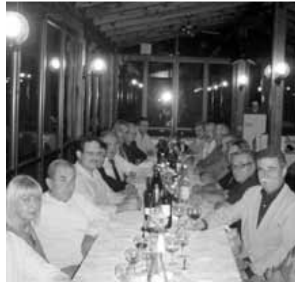
Un momento della degustazione dei vini svoltasi a Carentino: la premiazione del concorso enologico si svolgerà il 7 ottobre