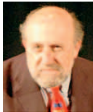
Enrico Beruschi è ospite

Intanto, in paese è tutto pronto per la fiera che co-