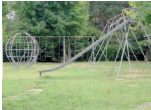
Quattordio: parco giochi al centro del dibattito

Molteplici invece sono gli ostacoli, o meglio le barriere architettoniche, che rendono il parco giochi una zona di difficile accesso per i cittadini disabili: in primo luogo la ghiaia che ricopre i vialetti pedonali interni non facilita gli spostamenti, e poi i basamenti dei giochi sono in cemento ma soprattutto sono sporgenti e quindi pericolosi. Due altri aspetti, di primaria importanza, riguardano la totale assenza di servizi igienici