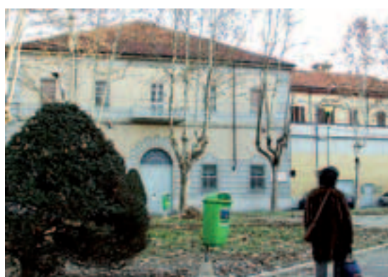
Il carcere Don Soria