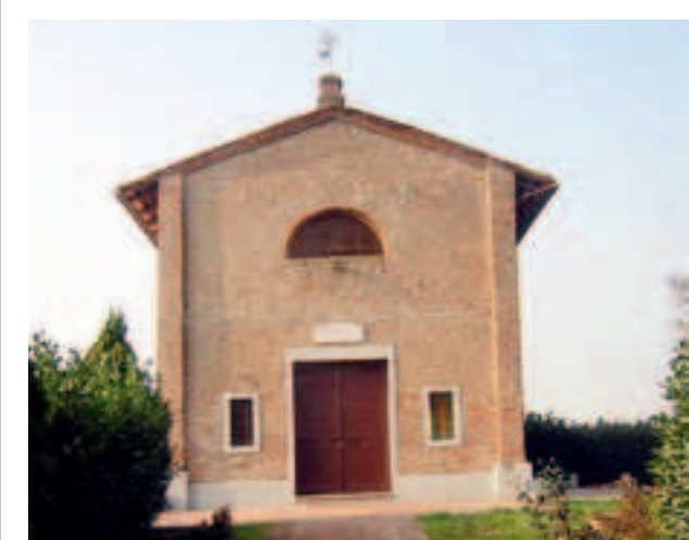
San Rocco, la chiesetta da cui era stata rubata la Via crucis