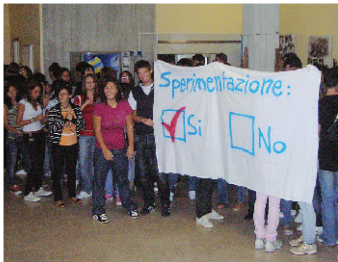
Ieri mattina protesta al liceo Pascal di Ovada