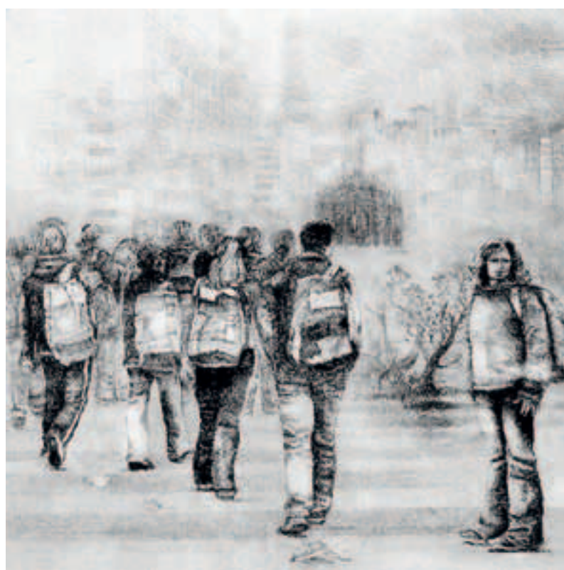
Una delle opere in concorso alla Biennale internazionale per l'incisione

Inizia l'iter selettivo delle opere inviate da 653 partecipanti al concorso da 56 nazioni