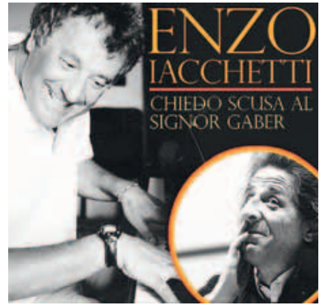
La locandina dello spettacolo di Enzo Iacchetti

Lo scorso 3 novembre si è tenuta nel comune di Rivalta Bormida una importante riunione alla quale erano presenti, tra gli altri, l'onorevole Massimo Florio, il consigliere regionale Rocchino Muliere, l'assessore provinciale Lino Rava, i consiglieri provinciali Fornaro ed Ottria, numerosi sindaci ed amministratori locali, nonché rappresentanti di associazioni ambientaliste sulla questione Acna. Durante i lavori dell'assemblea si è deciso di intraprendere importanti e concrete iniziative sull'argomento, tra le quali l'adozione di un ordine del giorno da approvare dai Consigli dei comuni della Val Bormida e da sottoporre ai consigli provinciali di Alessandria, Asti e Cuneo. (S.D.)