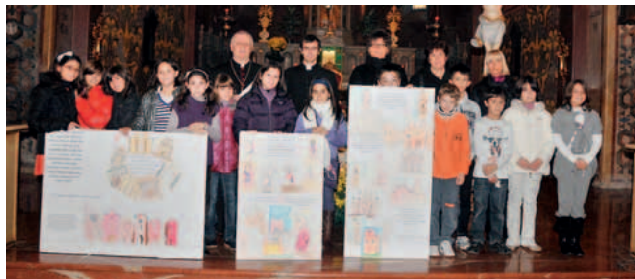
I bambini in posa con il vescovo Versaldi mostrano fieri e cartelloni che hanno realizzato