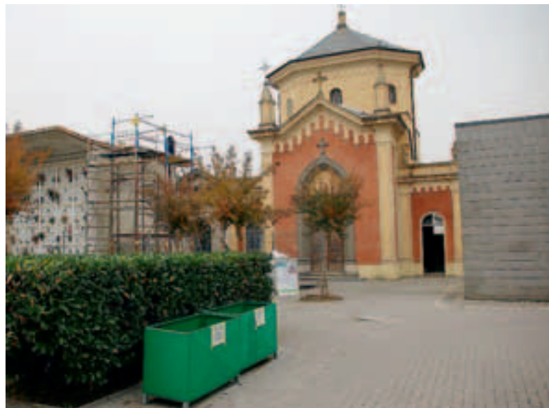
Il cimitero interessato dai lavori di smaltimento dell'eternit

MIRABELLO PROGREDISCE E SPERA DI ESSERE 'APPETIBILE' ALLE AZIENDE