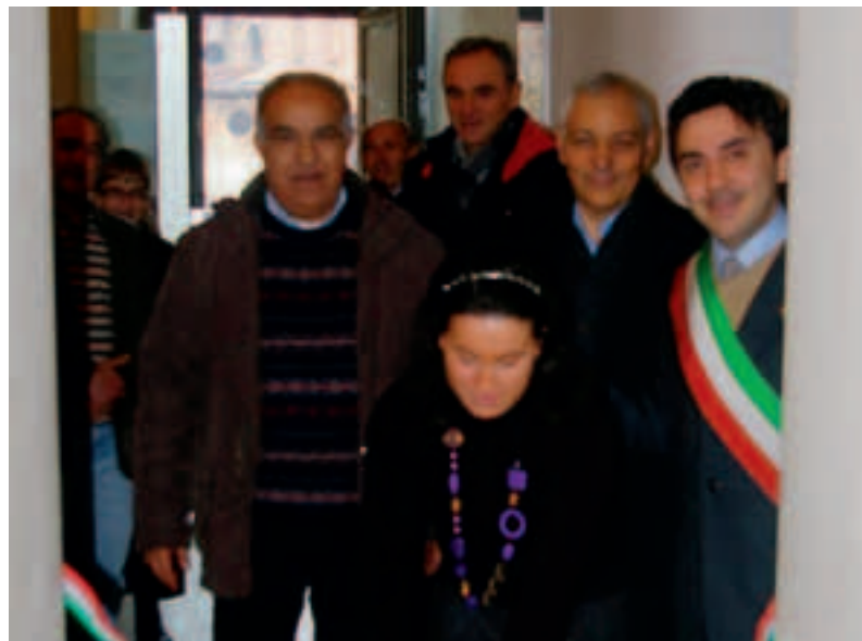
L'inaugurazione dello sportello amianto di Mirabello