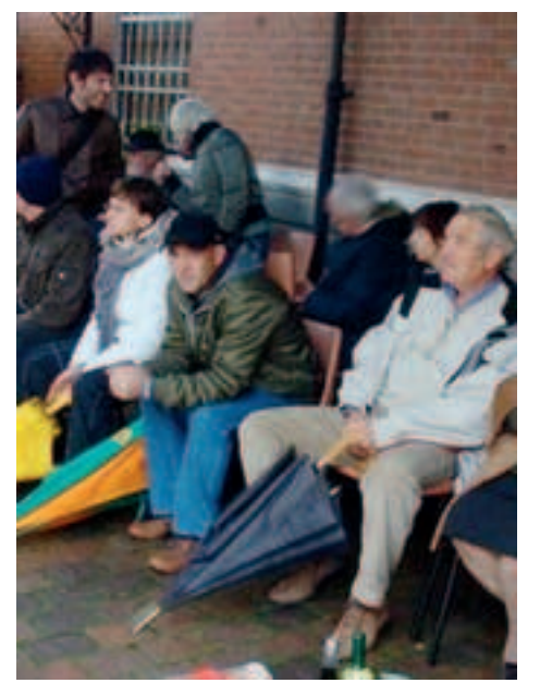
M.B. Momenti dell'incanto, la ultracentenaria tradizione di Ognissanti a Giarole