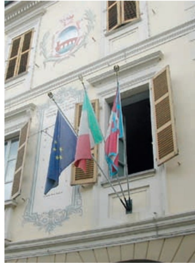
In Municipio si è discusso di agevolazioni al commercio