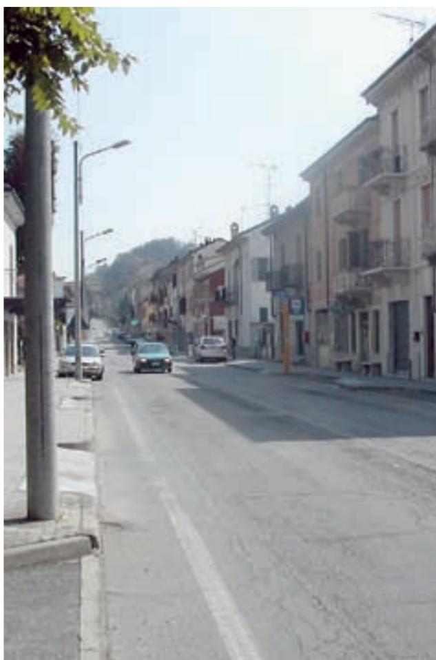
Lavello di Ozzano: strada a rischio per l'eccessiva velocità