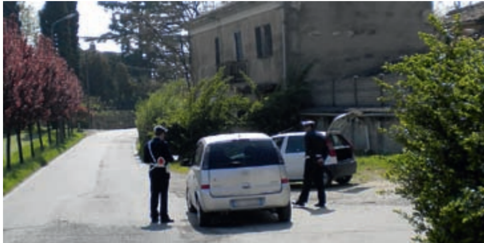
Un controllo con autovelox in atto dalla Polizia Locale dell'Unione a San Martino di Rosignano

Territorio Ad Ozzano, San Giorgio, Rosignano, Cella Monte, Sala, Terruggia, Treville e Olivola