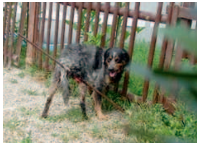
Il cane ferito: ci sono volute due ore per curarlo

dino di Castelnuovo Scrivia, ha un'ora d'inizio: le 11. Il cane si ferisce, in via XX Settembre, con un paletto di ferro di un cancello. Sono guaiti di dolore. Un ragazzo, che cerca di liberarlo, viene azzannato e finisce al pronto soccorso. Seguono telefonate al 112, che avvisa il servizio veterinario chiedendo «un intervento con la massima urgenza, al fine di sedare il cane». Arriva un fabbro che, con un flessibile, taglia il paletto. Arriva anche il sindaco. E arrivano pure i carabinieri, i vigili e alcuni cittadini attratti dai guaiti. Solo quelli del servizio