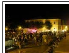
un momento della sagra