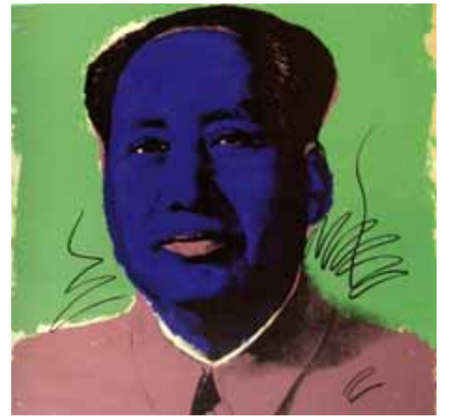
Mao Tse Tung secondo Andy Warhol. A Carbonara

D_43 Galleria Gamondio, Chiesa di Santo Stefano, via Milite Ignoto Q. inaugurazione venerdì alle 18.30, aperta fino al 3 ottobre O. giovedì e venerdì, 21 - 22.30; sabato e domenica, 16.30 - 19.30, 21 - 22.30, martedì 21 settembre, 16.30 - 19.30, 21 - 22.30