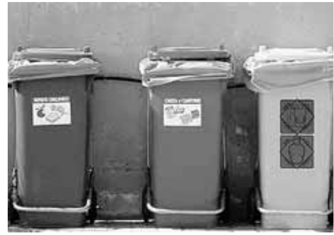
Sale, prosegue il controllo sui rifiuti

L'esito dei controlli ha rilasciato il 72 per cento di bollini verdi, 20,5 gialli e 7,2 rossi per quanto riguarda i rifiuti organici, 18 per cento, 37,9 gialli, 43,3 rossi. «Abbiamo raggiunto un buon livello di raccolta differenziata prossima al 50,36%, i margini di miglioramento siano ancora notevoli, infatti circa il 40% dei contenitori del rifiuto indifferenziato controllati presenta all'interno ancora notevoli quantità di materiali recuperabili».