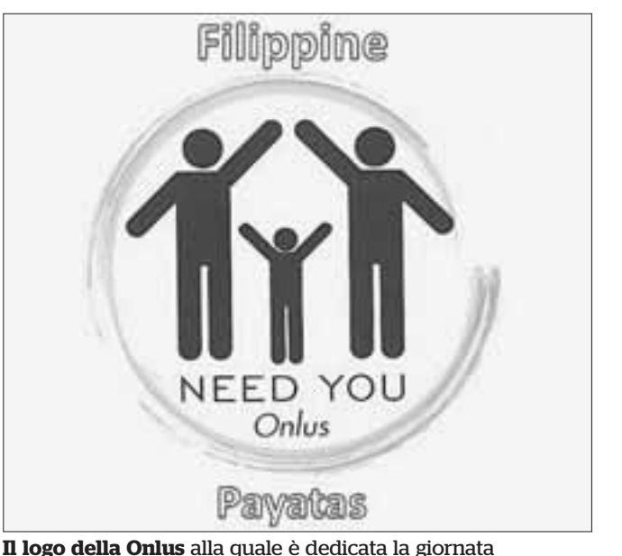
Il logo della Onlus alla quale è dedicata la giornata