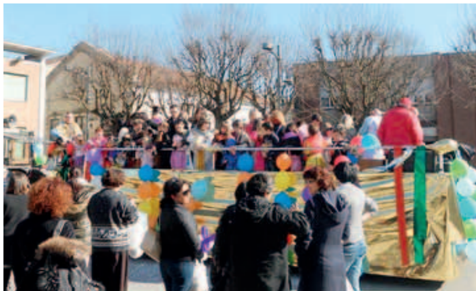
Il carro che domenica scorsa ha allietato il Carnevale dei bambini a Solero