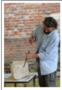
Simposio di Scultura (Immagine 1 di 4)

QUARGNENTO - Sabato 21 e domenica 22 maggio 2011 a Quargnento, dalle 9.00 alle 18.00 in Piazza I° Maggio andrà in scena il III Simposio di Scultura in tufo del Monferrato. L'Amministrazione Comunale, in collaborazione con l'Associazione per l'Arte e la Cultura "Il Nuovo Futurismo Onlus" e il dott. Pasquale Zanellato, all'interno dell'evento Riso&Rose in Monferrato organizzato da Mon.Do, si propone di promuovere e diffondere la produzione artistica con l'utilizzo di materiale del territorio monferrino. In momento in cui la tecnologia è sempre più spinta verso un "futuro" ancora da scoprire con connessione informatica, immediatezza mediatica, imprese sportive...bolidi della formula 1...il sovrapporsi veloce e labile dei tentativi di definizione per un'immagine simbolo della velocità ci induce alla ricerca di un archetipo nel mondo dell'arte.