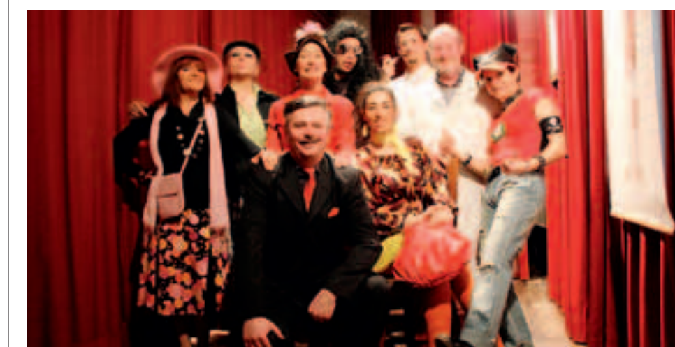
La compagnia teatrale impegnata domani sera a Castelletto Merli