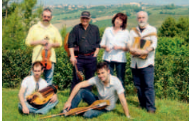
I Tre Martelli in formazione risorgimentale

L'evento Musica per l'Unità d'Italia ha visto la sua prima esecuzione nel novembre scorso al "C'era una volta" in piazza della Gambarina, grazie al contributo della Fondazione Cassa di Risparmio di Alessandria, e replicato varie volte, tra cui il 19 marzo a Rivoli.