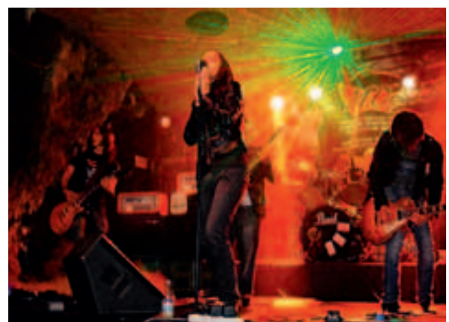
Gli Arizona Dogs hanno vinto Lustando Music Contest

Sabato prossimo invece, 4 giugno il Mephisto Rock Café di Lu saluterà il pubblico per la pausa estiva con la festa di presentazione di Lustando Music Festival 2011. Dalle 22 a ingresso gratuito quattro dj per quattro dj set che selezioneranno il meglio della musica indie rock internazionale.