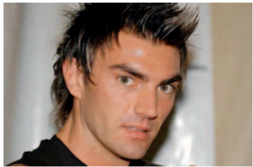
Il dj Gabry Ponte stasera ospite alla Valfrè

L'altro appuntamento dedicato agli studenti è il concerto di Giusy Ferreri l'11 giugno in piazza della Libertà a ingresso libero offerto dal Comune. P.B.