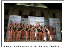
Una selezione di Miss Italia

QUARGNENTO - L'appuntamento con Miss Italia a Quargnento è fissato per sabato 4 giugno dove verrà assegnata la fascia di Miss Deborah. La splendida località alessandrina, nota per la basilica che conserva le spoglie di San Dalmazio, ospiterà l'evento in Piazza I Maggio, a partire dalle ore 21.