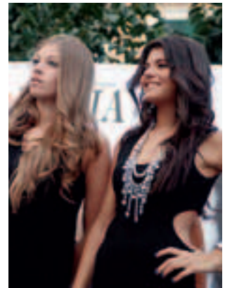
Meglio la bionda o la mora?