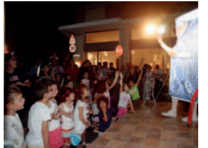
Castellazzo, anche i bambini attratti dallo spettacolo