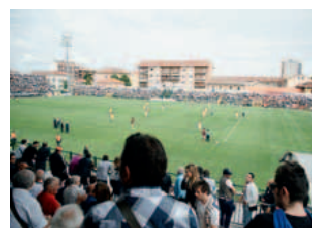
Canone dello stadio e utenze: arretrati per 94mila euro

Alle 18.30 di ieri, poi, altro motociclista ferito, per un sinistro avvenuto in città.