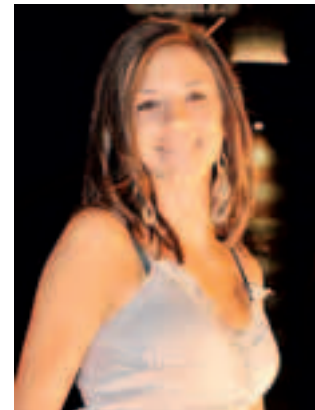
La cantante Noemi Zambon