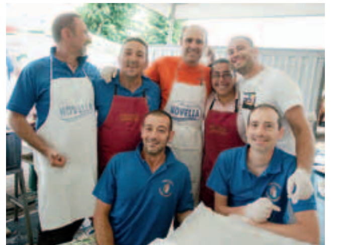
Carentino, allegria in una pausa di lavoro