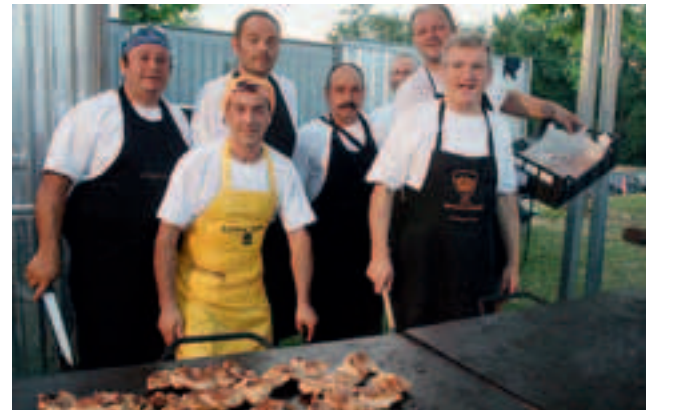
Anche da Cantalupo a Carentino con specialità alla griglia