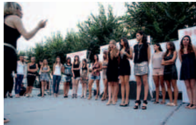
Istruzioni alle ragazze prima della sfilata