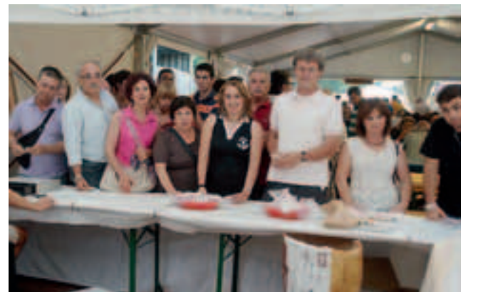
In coda alla cassa prima della cena carentinese