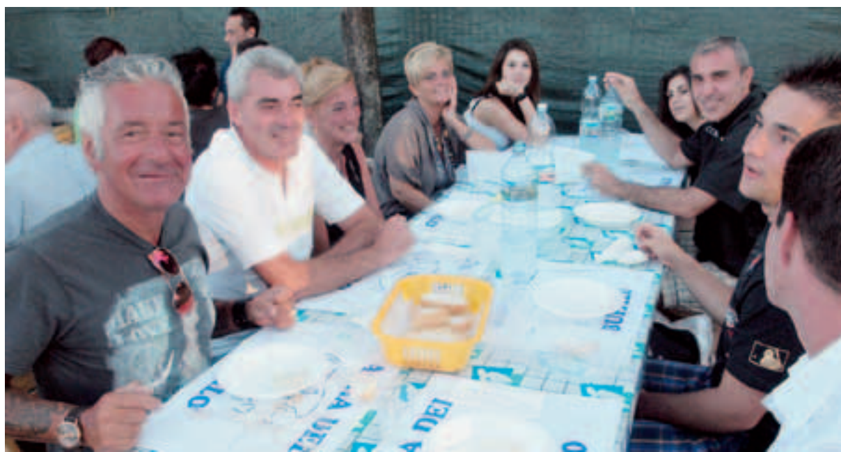
Frugarolo, lo scorso fine settimana la sagra del bufalo è stata un successo. In provincia le sagre continuano...

Festa della birra a Valmacca, domani dalle 18 a tarda notte, con birra artigianale a volontà e grigliata. Molto spazio alla musica con le cover band Bac Symphony, Experiment, An Idee Tear, Round About, Antabuse, Wild Funk. Dunque, ampio spazio a rock, hard rock e metal. Dalle 15, inoltre, mostra mercato ed esposizione di