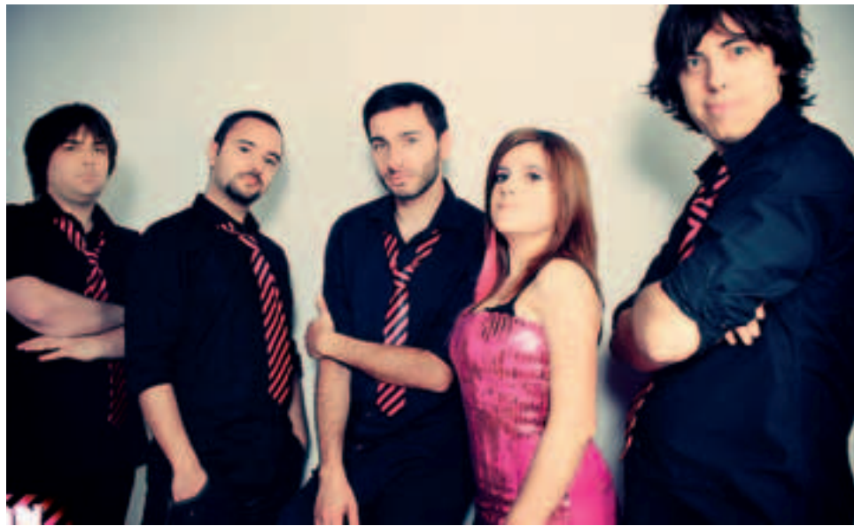
La band Non Puls Ultra domani a Valmilana

L'appuntamento rientra nella rassegna Notestive, organizzata dal Comune - assessore al Decentramento che questo fine settimana proporrà anche una serata anni '60/'70 all'Avis (venerdì) e un'altra occasione di svago e divertimento sabato 13 agosto alle 21.30 a Casabagliano con Enrico Cremon e la sua orchestra.