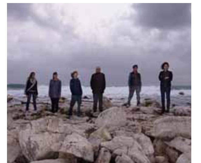
Una scena del film "I Malavoglia"